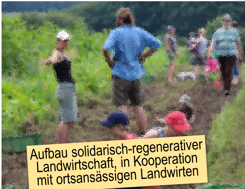
Aufbau solidarisch-regenerativer Landwirtschaft, in Kooperation mit ortsansässigen Landwirten