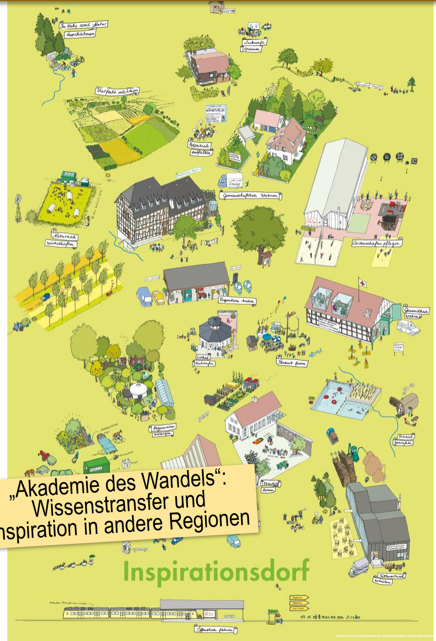
„Akademie des Wandels“: Wissenstransfer und Inspiration in andere Regionen