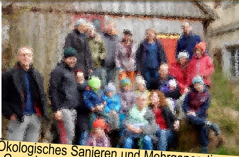
Ökologisches Sanieren und Mehrgenerationengemeinschaftswohnen (statt Neubaugebiet): „Neues Leben in alten Mauern“